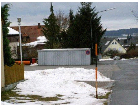
Neue Straßenleuchte in der Pleysteiner Straße (links im Bild privat errichtete Lampe)

Ein Peitschenmasten (Abbau aus der Bernriether Straße) ist noch im Besitz der Gemeinde. Die Anschlussarbeiten würden 580, 45 € betragen.