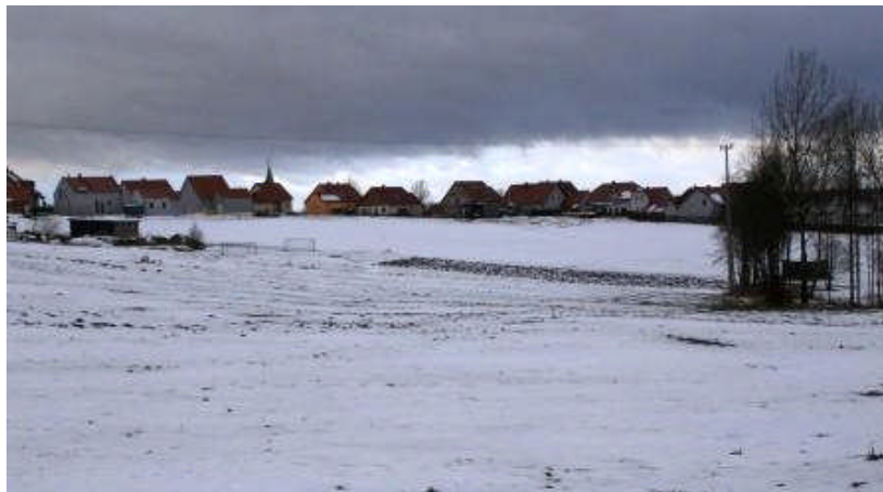
Baugebiet „Am Badeweiher“ Langsam werden schnell bebaubare Grundstücke in Waldthurn knapp

Nach Erkenntnissen und Berechnungen des Kreisbaumeisters wären in Waldthurn rund 47 Wohnbau-Parzellen bebaubar, unter Heranziehung des Flächennutzungsplans sogar 63 Grundstücke. Selbst wenn man wegen fehlender Erwerbsmöglichkeiten die bebaubaren Parzellen auf 30 reduziert, könnte in Waldthurn unter Berücksichtigung der Bautätigkeit in den letzten 3 Jahren für die nächsten 20 Jahre Wohneigentum errichtet werden.