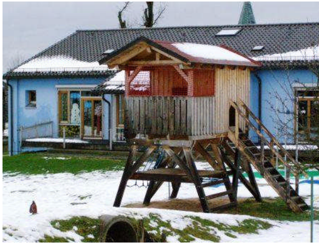
Der Spielgarten der Kindertagesstätte – Terrasse muss repariert werden