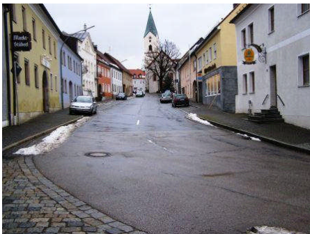
Marktplatz Waldthurn: Konzept zur Marktentwicklung schon 2008 möglich