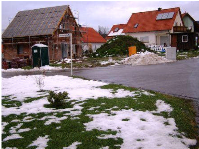
Baugebiet am Badeweiher – Baufirma leistet nun Schadensersatz