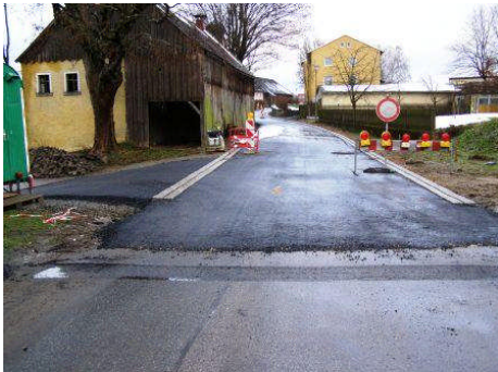
Dorferneuerung in Albersrieth: Teilstück der Dorfstraße zwischen Kirche und Feuerwehrhaus kann noch 2007 fertig gestellt werden