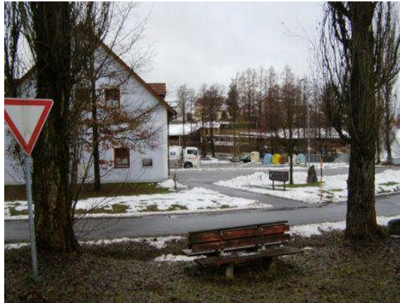
Feuerwehr Waldthurn braucht Platz für technisches Gerät

Der Wunsch des Bürgermeisters nach Einbindung des Ansinnens der Feuerwehr in die bevorstehende Dorferneuerung ist nachvollziehbar. Über die Notwendigkeit der Errichtung einer Lagerhalle besteht eine gewisse Skepsis in der Diskussion. Nachgefragt wurde, ob nicht die neue Bauhofhalle das feuerwehrtechnische Gerät mit aufnehmen könnte. Inwieweit dadurch unzumutbare Arbeiten bei anstehenden Vereinsfesten (Ausräumen der Halle und Zwischenlagern an anderer Stelle) drohen würden, müsste noch geklärt werden (ggf. Ortstermin mit Bauausschuss).