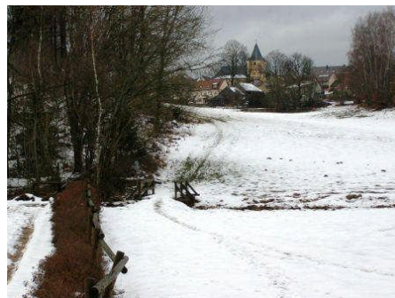
Könnte bereits 2008 realisiert werden: Ausbau des Wegs von der Kläranlage nach Lennesrieth über die Luhebrücke